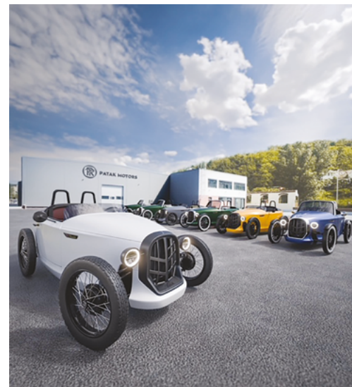
Vizualizácia - PATAK MOTORS Production, s.r.o.

PATAK MOTORS Production, s.r.o. je inovatívna slovenská automobilová spoločnosť, ktorá sa zameriava na vývoj, výrobu a predaj elektrických a benzínových vozidiel Rodster, ktoré bude vyrábať práve vo Fil'akove. Mestské mikroauto v štýle 30. rokov 20. storočia kombinuje štandardy modernej éry s prak-