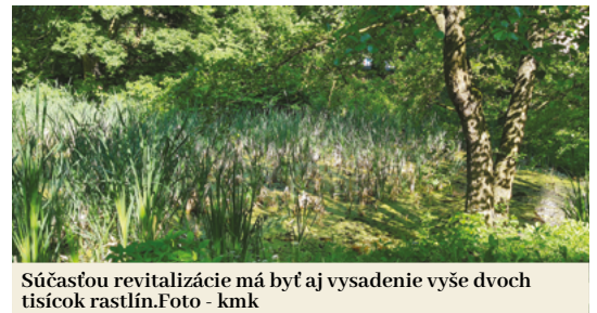
Súčasťou revitalizácie má byť aj vysadenie vyše dvoch tisícok rastlín.

strany a bude sa dať prechádzať okolo celého jazierka,“ doplnil primátor s tým, že mólo a chodníky budú bezbariérové.