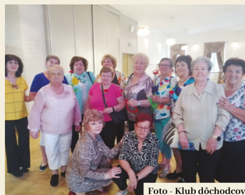
Foto - Klub dôchodcov